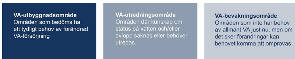
Figur 2. Beskrivning av den uppdelning av områden som behovsbedömningen resulterar i.

Gagnef kommun och Dala Vatten och Avfall AB delar efter översynen in befintliga områden i två kategorier; utrednings- och bevakningsområden, vilket beskrivs i kapitel 3 och illustreras i bild nedan. På sikt och vid aktualisering av planen kan områden tillkomma i kategorin utbyggnadsområden.